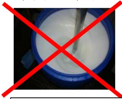
太多渦流容易產生問題