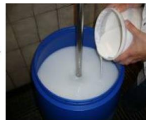
步驟2：輕輕添加BAYSCENT 到水中，輕輕混合均勻